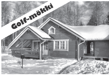
Tammisalons Ski ja Tammisalons Golf

Tammisalons VPK tekee merkittävää paikallista nuorisotyötä ja tarjoaa maksuttoman harrastusmahdollisuuden Tammisalons ja lähialueiden lapsille ja nuorille. Järjestämme myös taloyhtiöille ja yhdistyksille maksutonta paloturvallisuus- ja alkusammutuskoulutusta. Olemme lisäksi kaikkina vuorokauden aikoina valmiina lähtemään kol-